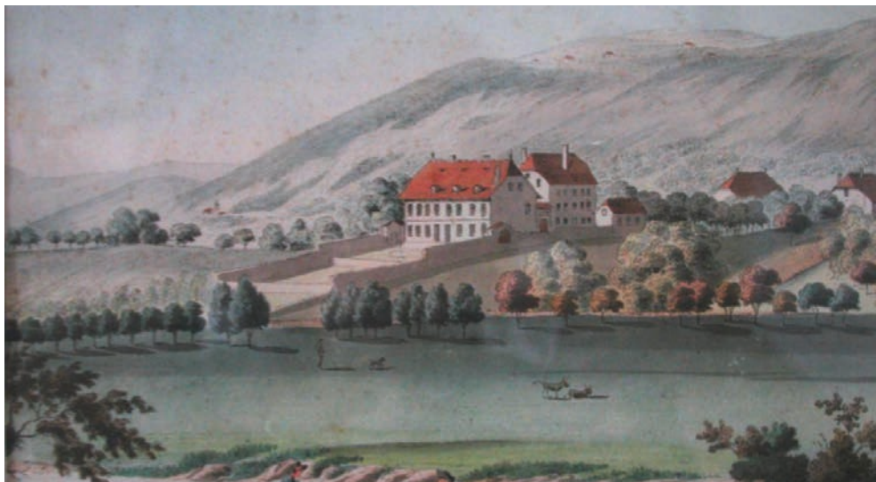
Montmirail, vor 400 Jahren als Landschlösschen über dem Zihlkanal gebaut.