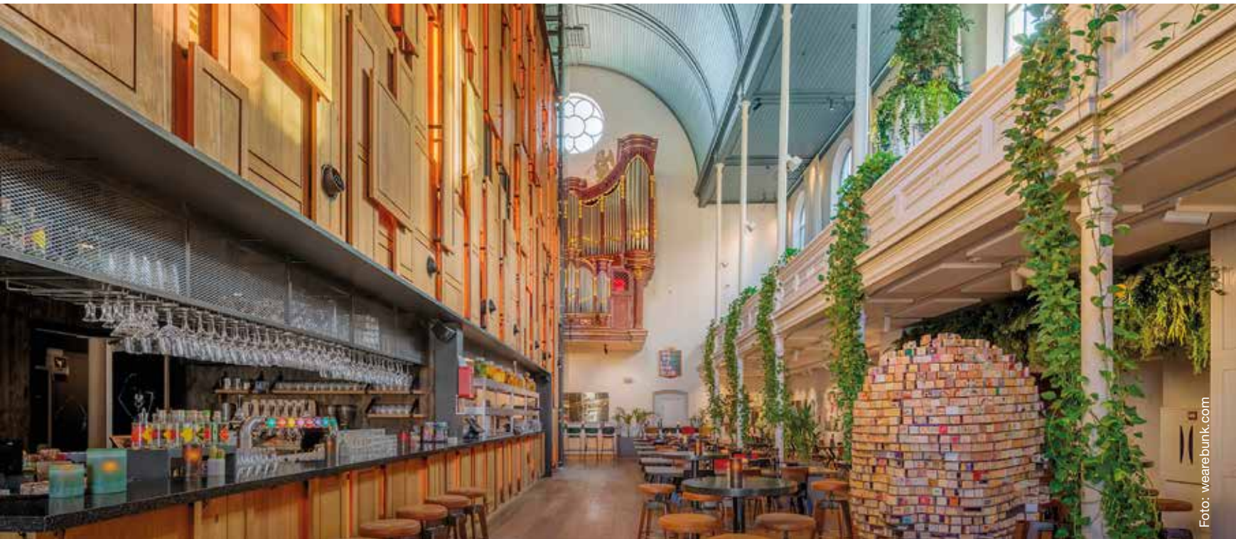
Eine umgenutzte Kirche: Hotel und Restaurant Bunk, Utrecht. Die Kirchenbänke als Deko-Element.