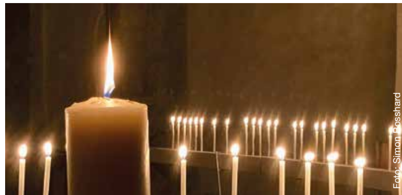
Stimmung in der Osternacht 2024.

18.00 Kirchgemeindehaus Fritigsfiir Eintrudeln ab 18.00 Uhr, Nachtessen und Feier ab 18.30 Uhr, mit Kinderprogramm. Weitere Informationen sind an allen gängigen Orten erhältlich.