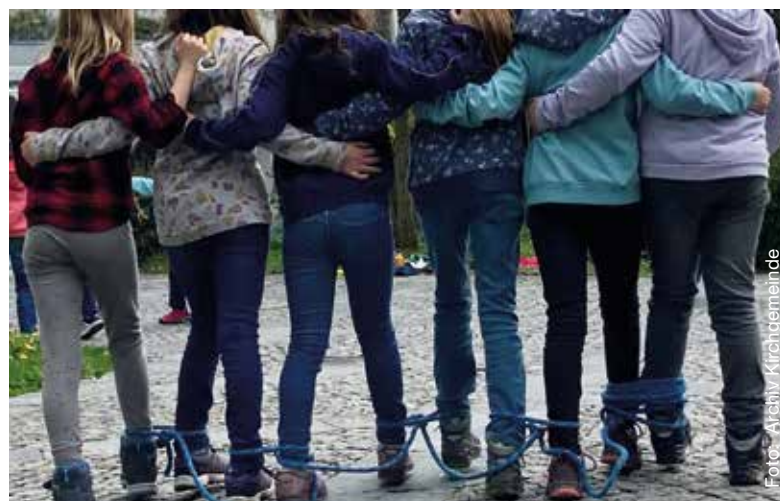
Zusammen in der Untiwoche in den Frühlingsferien viel erleben.