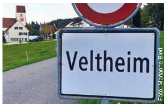
Das andere Veltheim mit Kirche.

MITARBEITERAUSFLUG // Es gibt in der Schweiz zwei Ortschaften, die sich Veltheim nennen. Da entstehen immer mal wieder Verwechslungen. Mitarbeitende der Kirchgemeinde Winterthur-Veltheim wollten daher das andere Veltheim kennenlernen.